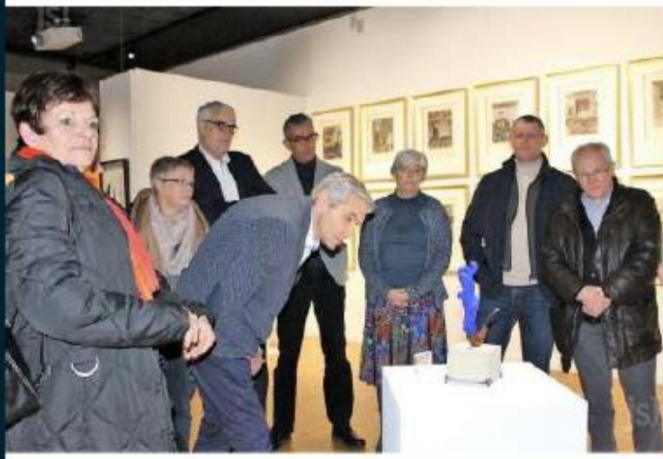
Pas de fumée sans feu, oeuvre en polymère et bleu Klein