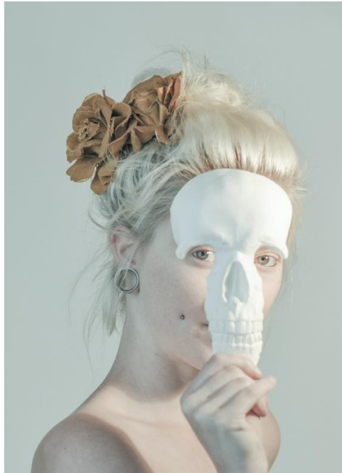
Nel-14512 – Memento Mori